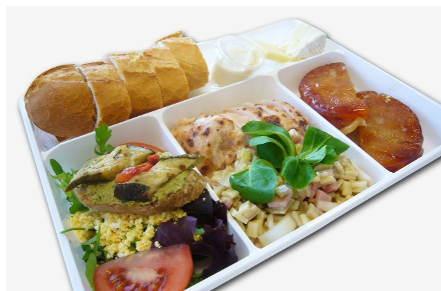
Béatrice CHAT, Diététicienne

Il est alors nécessaire de prévenir les hôtesses alimentaires