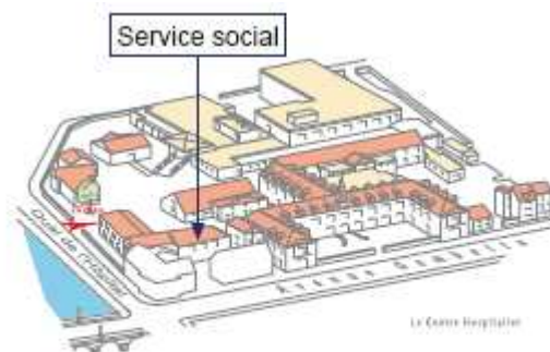
Entrée B, rez-de-chaussée