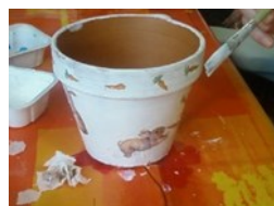
Activités de peinture