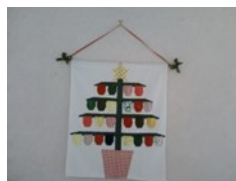
Activités de création