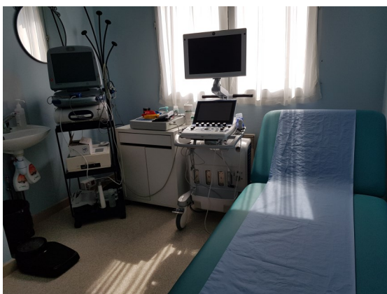
Bureau médical Consultations Plateau Technique