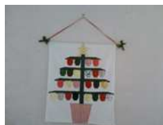
Activités de création