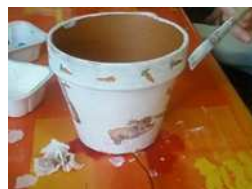
Activités de peinture